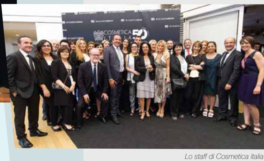
Lo staff di Cosmetica Italia